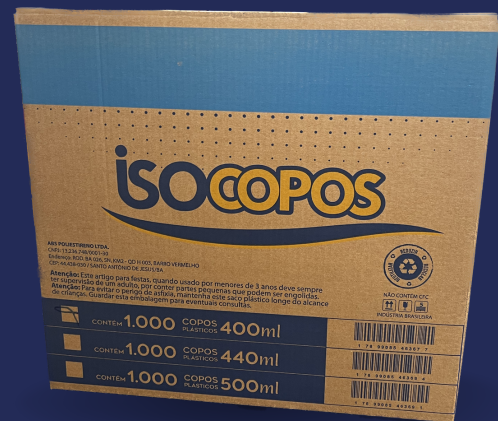
400ml 440ml 500ml