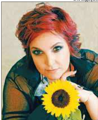
A artista apresentará seu novo show "15 anos, (Só) Eu e Você"